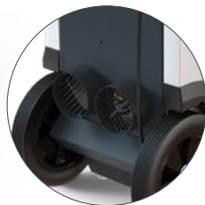
AD 935 S mit 1kW elektrischem Heizelement und 2x Ø100 mm Schlauchanschlüssen

Die AD 9-Serie ist eine innovative Technologie im Bereich der Kondensationsentfeuchtung, die hochmoderne Leistungsmerkmale mit maßgeschneiderten und umweltfreundlichen Lösungen kombiniert. Die Kondensationsentfeuchter der AD 9-Serie zeichnen sich durch ein standardisiertes und bewährtes Design in Kombination mit einem benutzerfreundlichen CC6-Bedienfeld aus, das eine drahtlose Verbindung mit dem Fernüberwachungssystem Simplify der Dantherm Group ermöglicht. Die auf Langlebigkeit ausgelegte AD 9-Serie vereinfacht Wartung und gewährleistet reibungslosen Betrieb in verschiedenen professionellen Trocknungsanwendungen.