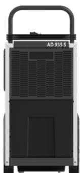
AD 935 S