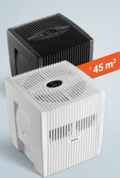
Comfort Plus Luftwäscher LW25

1 Für mittlere Räume bis 45 m², wie z. B. Wohnzimmer.