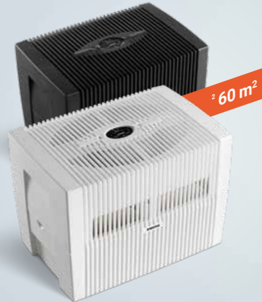
Comfort Plus Luftwäscher LW45

1 Für mittlere Räume bis 45 m², wie z. B. Wohnzimmer.