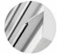
VKS ALU - Detailansicht